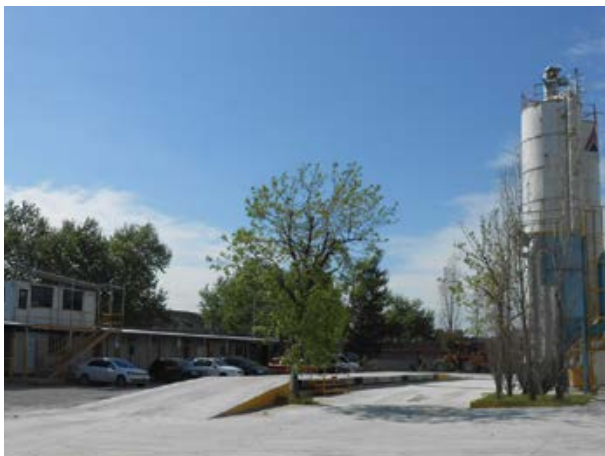
Importancia de cuidar el medio ambiente

La industria del hormigón elaborado genera emisiones al aire, vertidos, y residuos sólidos que deben ser, en primera instancia, disminuidos y tratados de una forma adecuada. Esto implica aplicar una serie de actividades dentro de la industria que en conjunto se denominan "buenas prácticas ambientales".