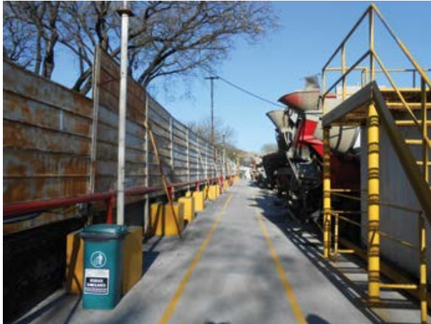
Clasificación de residuos en circulaciones de plantas