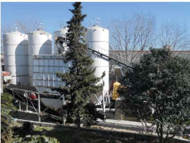
Planta de Hormigón Elaborado Sustentable

La Convención Marco de las Naciones Unidas sobre el Cambio Climático se realizó en 1992, en la llamada Cumbre de la Tierra de Río de Janeiro. Allí se resolvió impulsar un protocolo para reducir la emisión de los gases que provocan el calentamiento global. En 1997, se firmó el Protocolo de Kyoto (Ley 25438/01) (6) sobre el cambio climático, que entró en vigor en el año 2005.