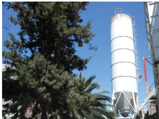
Promover el uso de las Buenas Prácticas Ambientales